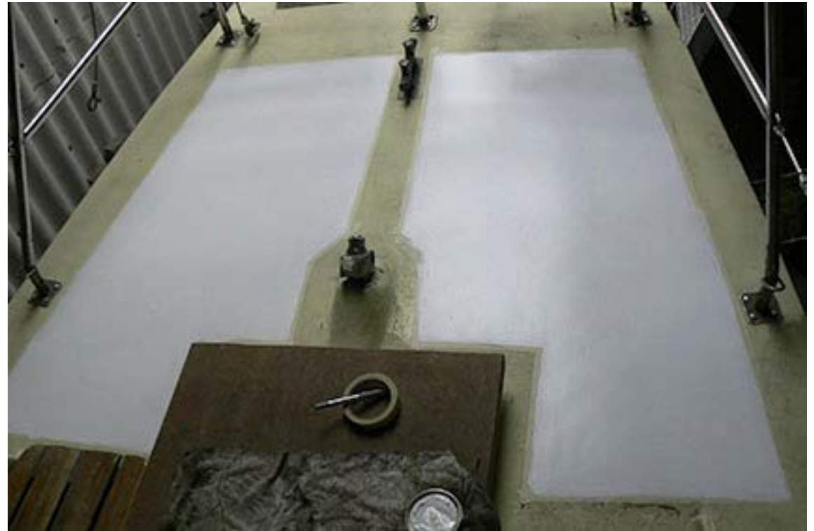
Achterdeck, die erste Farbe ist gemalt worden