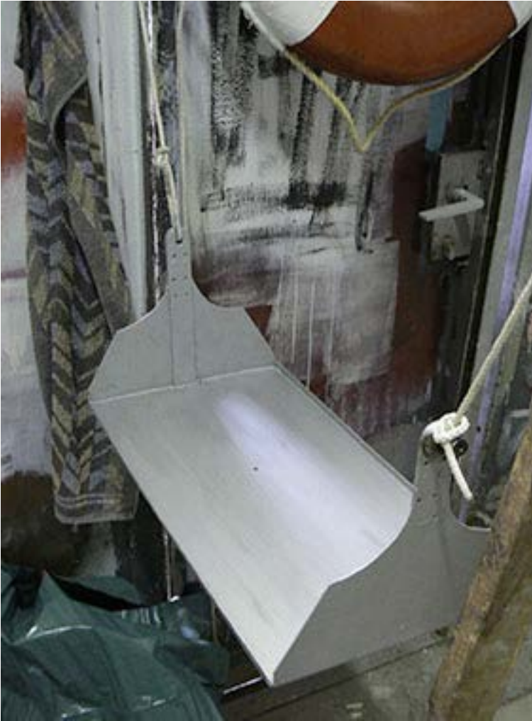
Herdaufhängung, geschliffen und 1. Anstrich

Winterlager & Kranen im Frühjahr 2014, wie schon in den Jahren zuvor, wurde auch in diesem Winter und Frühjahr fleißig an der alten Dame „ Adhara “ geschraubt, geschliffen, gemalt, lackiert, gesägt, geflucht, gelacht und getrunken. Die nachfolgenden Bilder geben einen kleinen Eindruck von den Mühen und der Ausdauer der Freunde der „ Adhara “. Ein herzliches Danke, Allen die mitgeholfen haben das Schiff wieder flott zu bekommen.