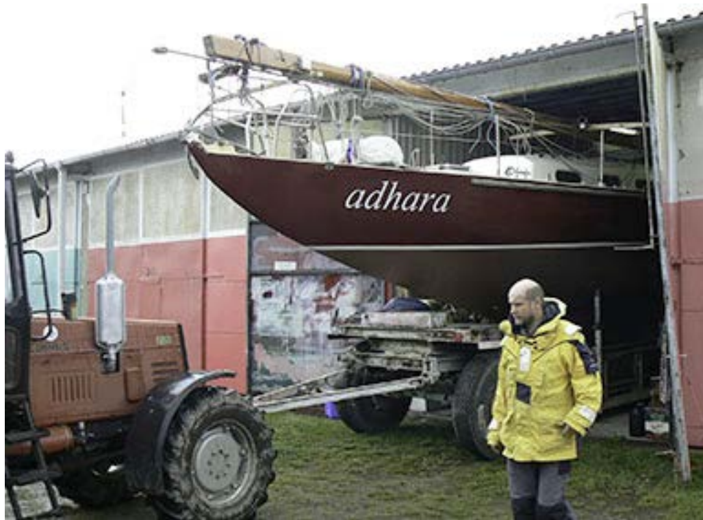
Vorhang auf für die Saison 2014, Auftritt „ Adhara “