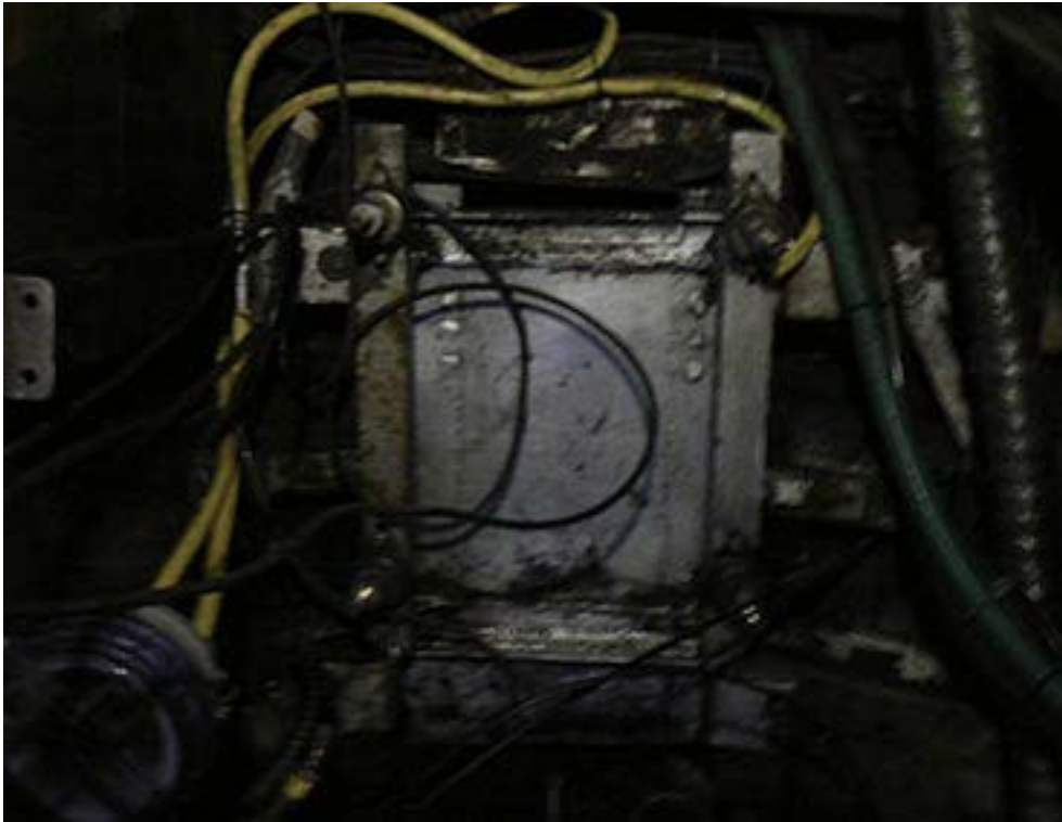
Motorraum von oben, der Italiener wird in der Werkstatt überholt