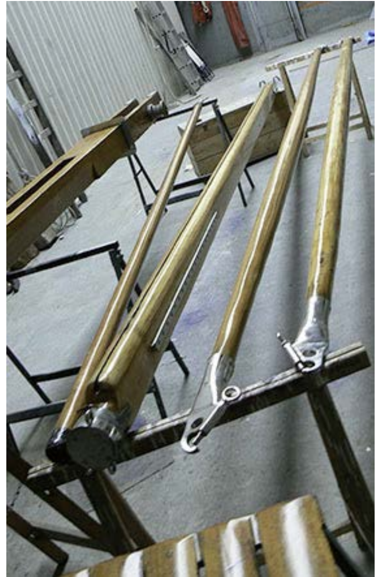
Maststuhl, Baum und Spibäume, sie warten auf OSMO